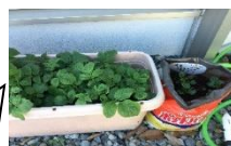
4/24 こんなに大きくなりました!!