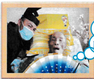
お客様の衣装を着た職員とパシャリ☆